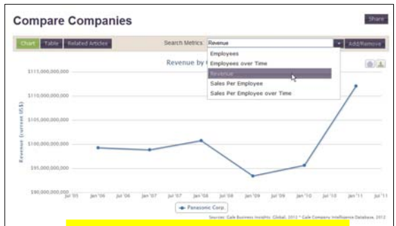
パナソニックの売上高をグラフ化

研究者と学生への事前調査によれば、研究と学習の中で、ネット環境で出来るようになればよいこととして最も多く挙げられていたのが、比較を行なうことでした。特定の国の中で種々の産業を比較すること、複数の国のあいだで同一産業を比較すること、複数の国のあいだで特定の経営のテーマについて比較すること、などです。研究者だけでなく学生も、 比較するという機能 がネット環境の中で最も必要とされると考えています。そこでこのデータベースでは、国、企業、産業という各レベルで、特定のデータ項目に関して複数の国、企業、産業の間で比較を行ない、 グラフにより可視化するツール を実装しました。そしてこの機能こそ、利用者がストーリーを組み立てるための、本データベースの肝なのです。