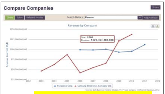
サムソンの売上高をグラフに追加