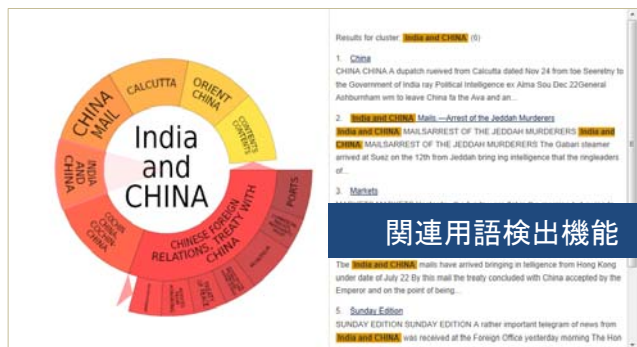
関連用語検出機能