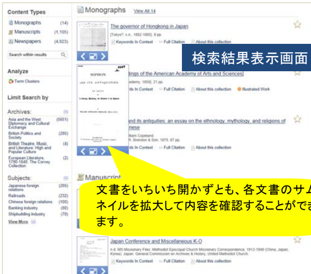
検索結果表示画面

文書をいちいち開かずとも、各文書のサムネイルを拡大して内容を確認することができます。