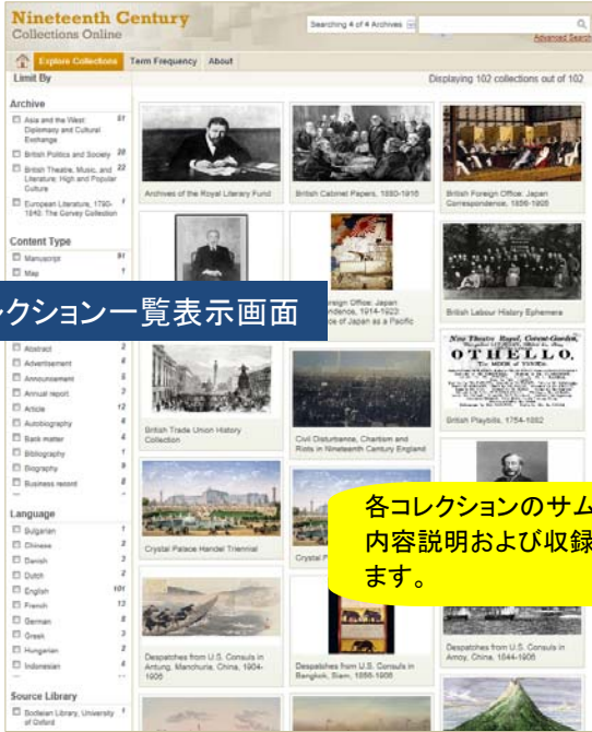
コレクション一覧表示画面

各コレクションのサムネイルをクリックすると内容説明および収録一覧のページを表示します。