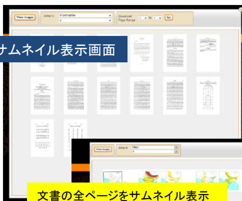
サムネイル表示画面