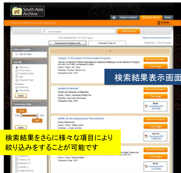
検索結果表示画面