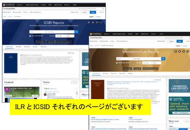
ILR と ICSID それぞれのページがございます